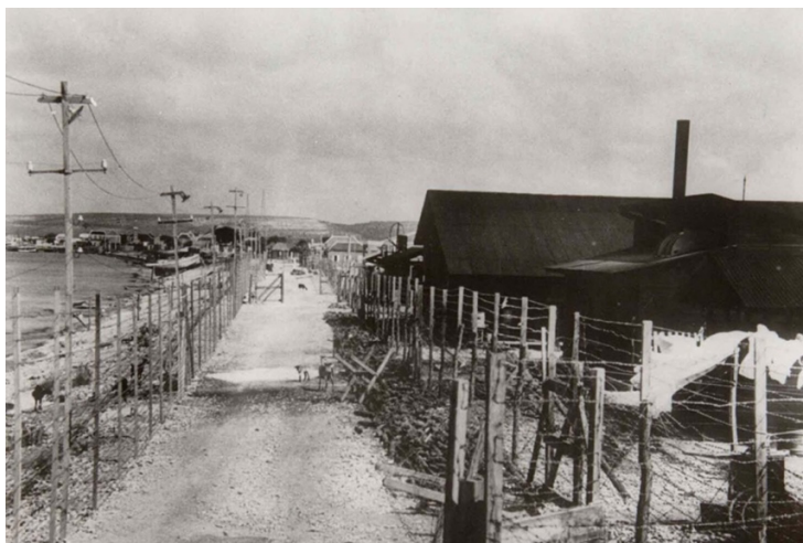
interneringskamp op Bonaire

Een praktische, inspirerende training voor iedereen die het verhaal van de Holocaust met respect, diepgang en interactie wil overbrengen.